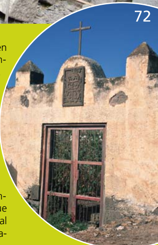
Pórtico de la Hacienda del Buen Suceso

Una vez superados los barrios de La Fula y La Montañeta, resaltan especialmente las espléndidas vistas de la vega agrícola de La Marquesa, y sus grandes extensiones de cultivo de plataneras salpicados de bellos ejemplares de palmera canaria, en la que sobresalen los edificios del Hotel Rural "Hacienda del Buen Suceso" y el Palacete de La Marquesa.