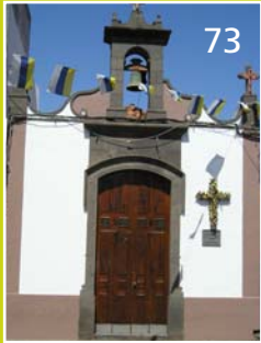
Ermita del Calvario